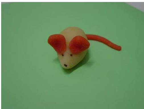
Le pegamos la colita y ya los tenemos.