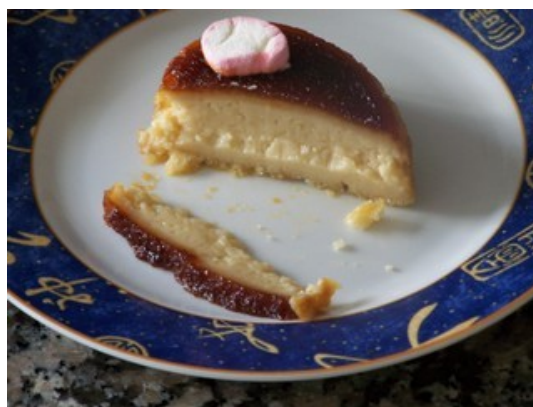
El bizcoflán osito