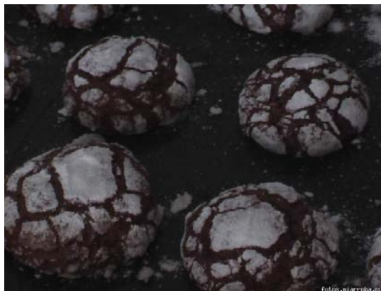
Un primer plano de las supergalletas